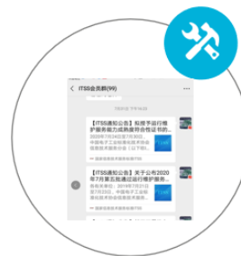
微信群 仅限会员单位加入